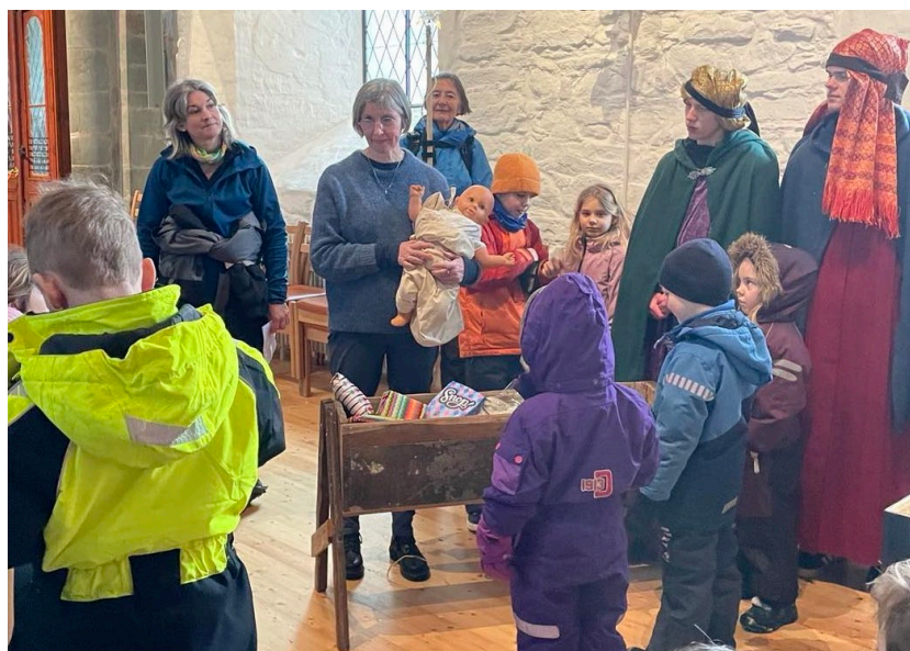
Stjernevandring i Stavanger domkirke har vært en populær aktivitet gjennom mange år.