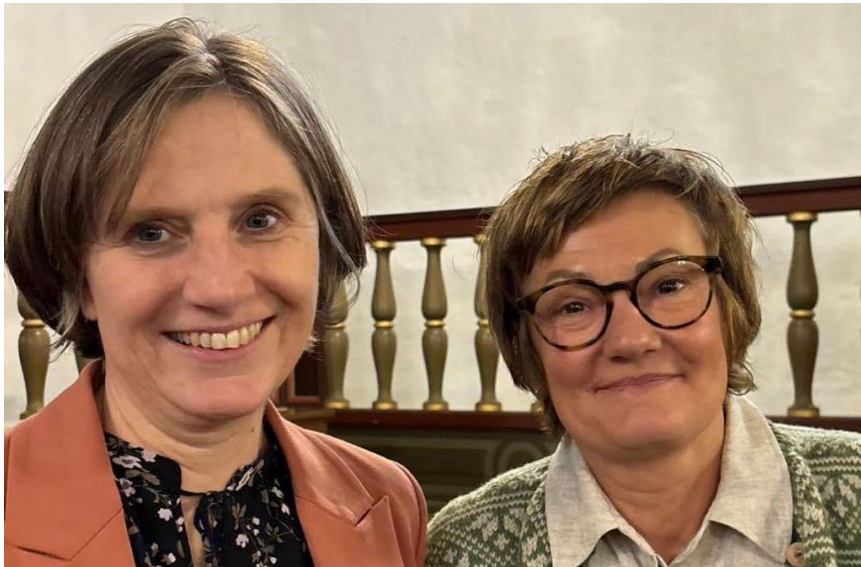
Barne- og familieminister Kjersti Toppe er engasjert rundt fullfinansiering av Kystpilegrimsleia.

Prosjektet er delfinansiert av Rogaland fylkes kommune, Karmøy kommune og Miljødirektoratet samt Regionalt Pilegrimssenter.