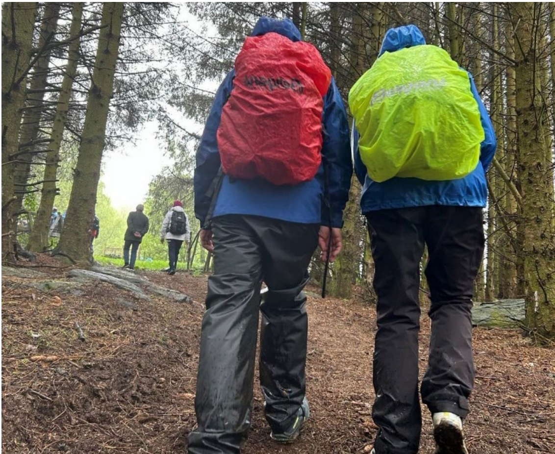
Nøkkelsted Stavanger arrangerte i mai en fantastisk vandring på den grønne øya Talgje