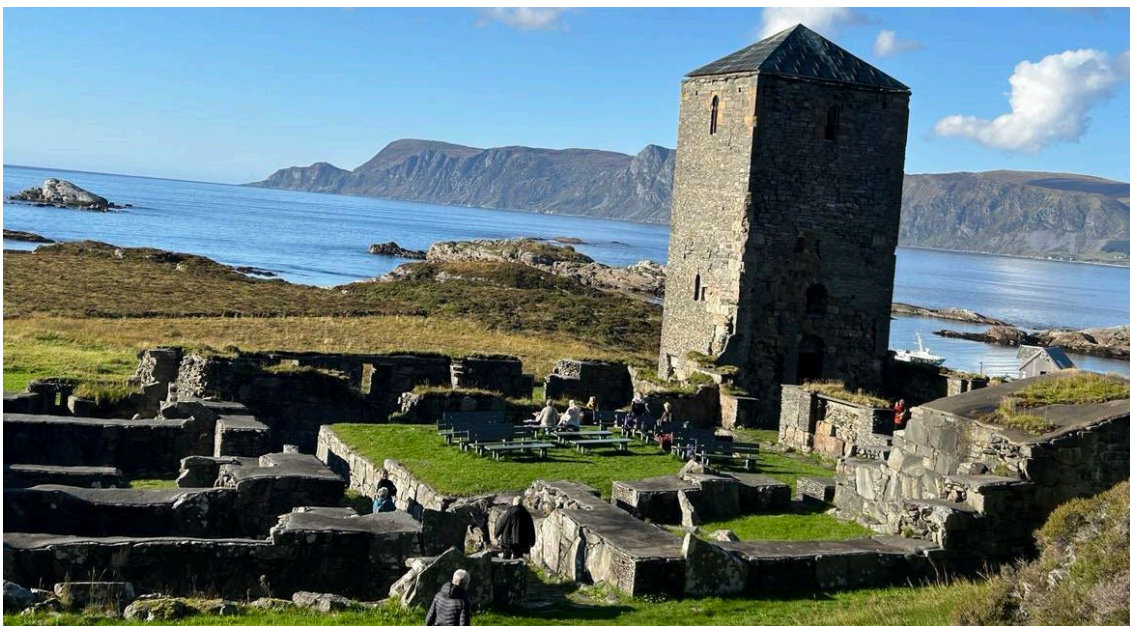
Strålende tur til øya Selja med fantastisk formidling av guider fra Klosterbåten

Kystpilegrimskonferansen i 2025 blir på Smøla 24.-25. september. Tema blir Den sammenhengende reisen.