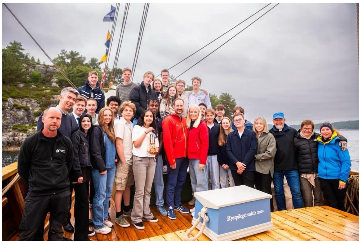
Fra Verdiseilas i forbindelse med 1000-års jubileum for kristenretten på Moster, juni 2024