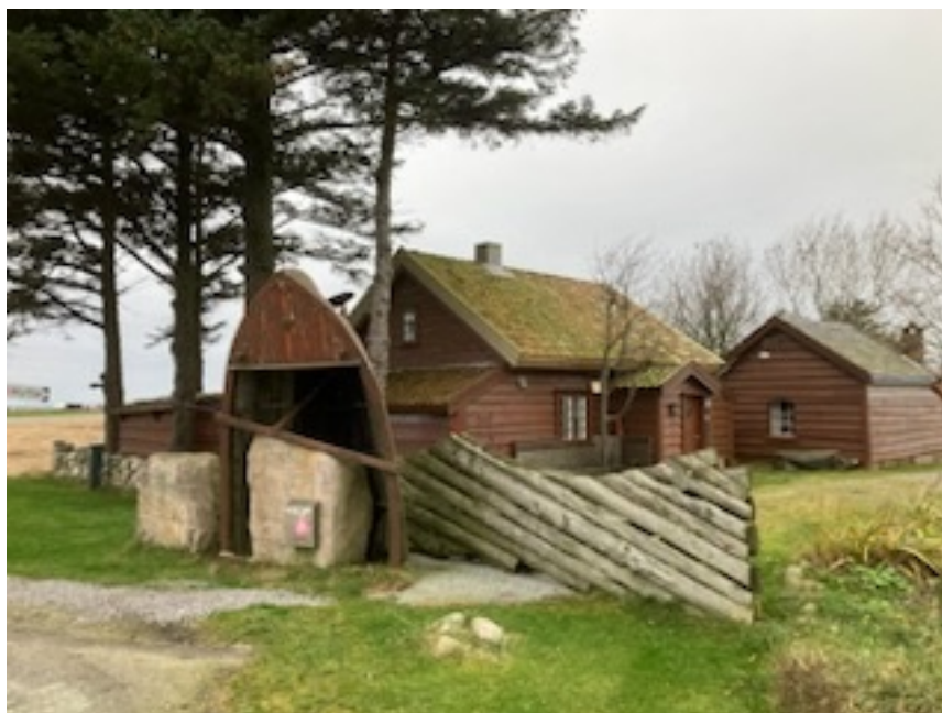
Huset ved havet er et nydelig overnattingssted, med Obrestranden som nærmeste nabo