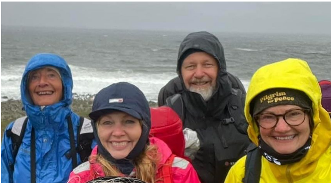
Studietur: Hvordan fungerer Kystpilegrimsleia som helårslei?

Hovedfokus for 2024 har vært å få opp bruken av Kystpilegrimsleia. Som del av arbeidet og nedfelt arbeidsplan, inviterte nøkkelstedene i Rogaland i høst pilegrimsutvalg fra Sør-fylket og andre samarbeidspartnere til studietur fra Egersund til Obrestad. Tema vi ønsket å belyse nærmere var: Hvordan fungerer Kystpilegrimsleia som helårslei? Hvordan er merkingen på de ulike stedene? Har vi tilstrekkelig med overnattingssteder langs Jærkysten? Har vi tilstrekkelig med åpne toaletter?