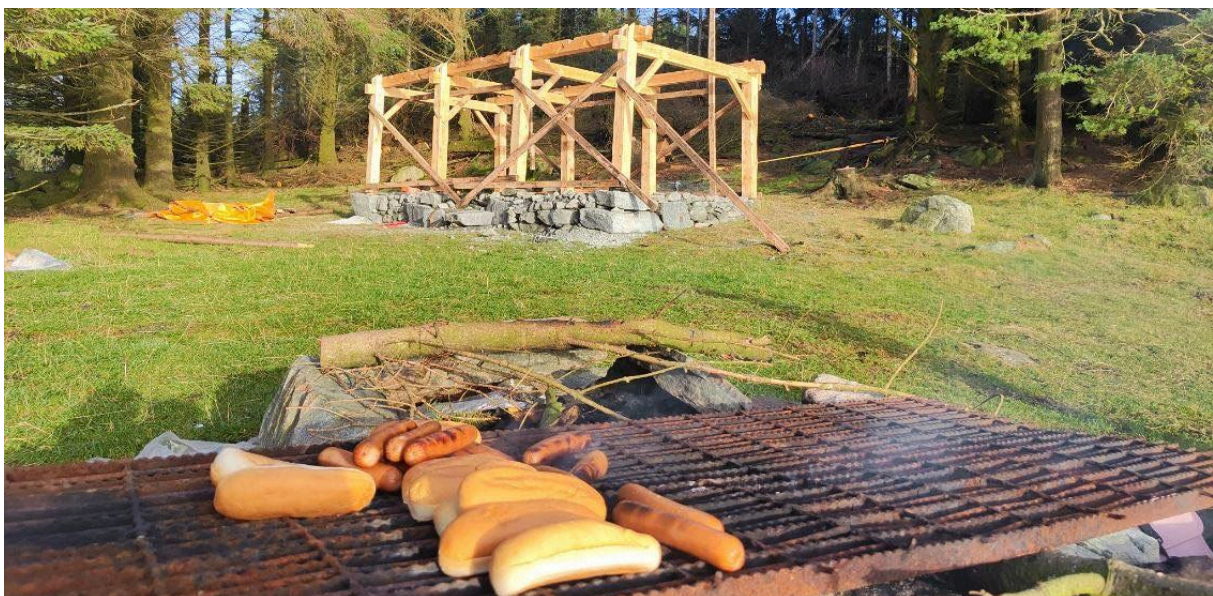
Givende samarbeid med Hauge videregående skole.

I desember 2022 var oppstartsmøte med arbeidsgruppe fra Karmøy kommune.